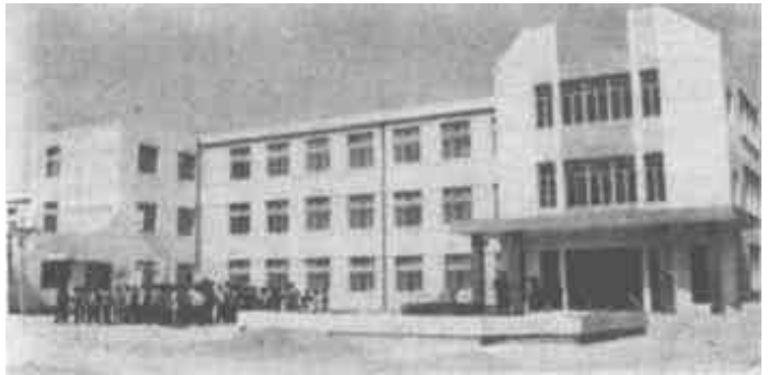
富裕起来的东营区辛店镇东赵村舍得投资办教育。图为他们投资90万元兴建的一座2273平方米的教学楼。